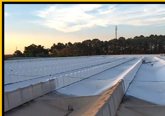
IMPERMEABILIZAÇÃO DE LAJE INDUSTRIAL