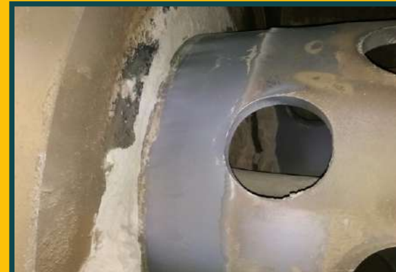
RECUPERAÇÃO DE EIXO