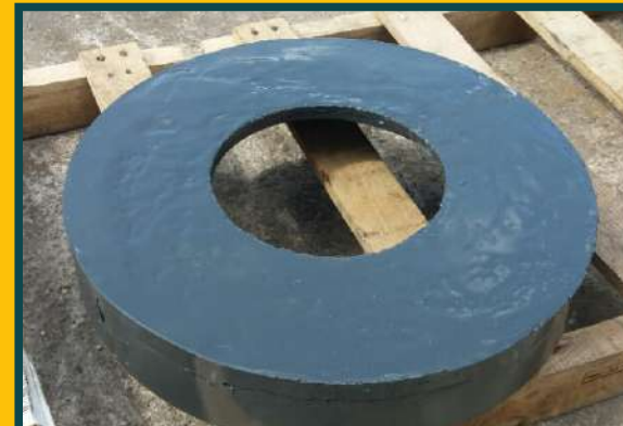
RECUPERAÇÃO DE TAMPA DE BOMBA