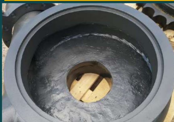
RECUPERAÇÃO DE BOMBA