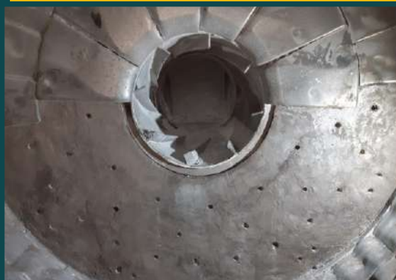
REPARO EM TESTEIRA DE MOINHO