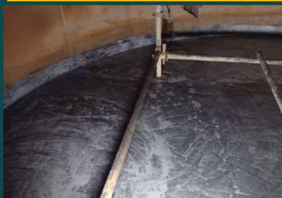
REVESTIMENTO EM FUNDO DE TANQUE