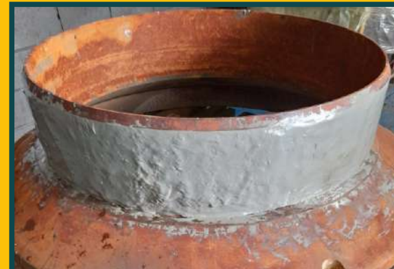
RECUPERAÇÃO DE ANEL DESLIZANTE